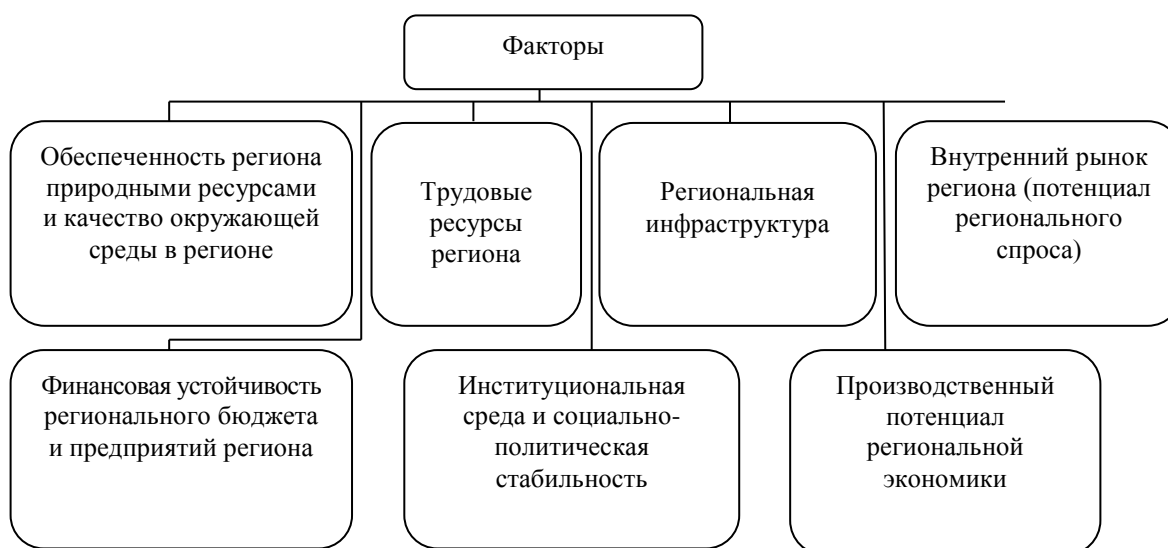
Рисунок 3 – Факторы региональной инвестиционной привлекательности

риск). По инвестиционному потенциалу край занял 33 место среди всех субъектов РФ (в 2015 г. – 32 место). В 2016 г. произошло значительное снижение инвестиционного риска – 37 место (2015 г. – 46 место), край поднялся на девять мест в данном рейтинге [4]. Национальное рейтинговое агентство (НРА) рассматривает инвестиционную привлекательность региона как результат взаимодействия ряда факторов, оказывающих влияние на характеристики показателей риска (целесообразность, эффективность и уровень) инвестиционных вложений на его территории. Это важнейшие факторы для всех инвестиционных проектов, осуществляемых на территории региона. Они оказывают значительное влияние на риск и доходность данных проектов. В рейтинге НРА рассматриваются семь факторов региональной инвестиционной привлекательности (рисунок 3).