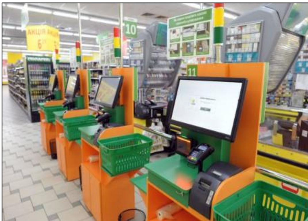
Рисунок 4 – Торговая точка, оснащённая системой self-checkout

Отдельным и актуальным вопросом является процесс контроля краж. Существует предубеждение, что система self-checkout даёт возможности для совершения воровства. Но в реальности за счёт усиленного видеонаблюдения и техноло-