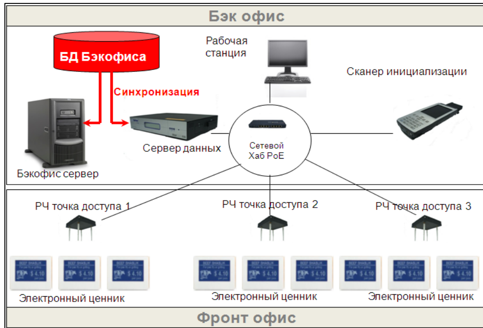
Рисунок 1 – Модель работы системы ESL

на своём месте, а 15 % покупок не совершаются из-за утеранных или неточных ценников. Поэтому электронная технология отображения цены в самое ближайшее время наберёт популярность [5]. Схема работы системы представлена на рисунке 1.